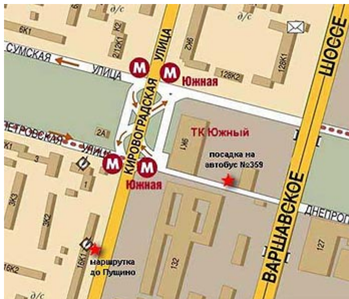
Схема 1. Расположение остановок автобусов и маршруток, отбывающих из г. Москвы в г. Пущино

ООО НПФ «Альбит» находится в городе Пущино на юге Московской области, примерно в 100 км к югу от Москвы, в 10 км от Симферопольского шоссе (М2, федеральная трасса «Крым»). В г. Пущино из Москвы можно добраться на автобусе и маршрутке. Время в пути между Москвой и Пущино на автобусе/маршрутке – от полутора до двух часов, в зависимости от загруженности дороги.